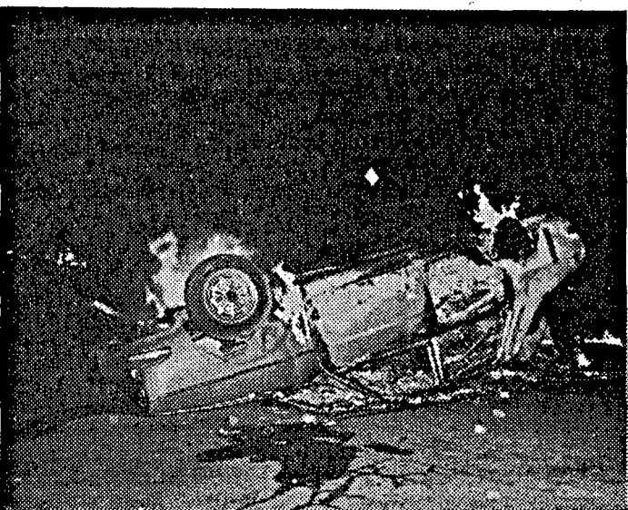
Szenen einer Straßenschlacht. Autos, Barrikaden und ein Supermarkt brannten in Kreuzberg. Rechts die Aufräumarbeiten vor der Ruine von „Bolle“. Das demolierte Kreuzberg mit seinem ausgebrannten Supermarkt war am Wochenende Touristenattraktion für die Besucher der Stadt. Echte Raritäten waren am Wochenende intakte Telefonzellen, die die Randalere überlebt hatten. Die Bilder stammen von unseren rasenden Fotografen Schulz, Stiebing und der ebenfalls rasenden Fotografin Lesniewski

Fortsetzung auf Seite 2 Tagesthema Seite 3 Kommentar auf Seite 4